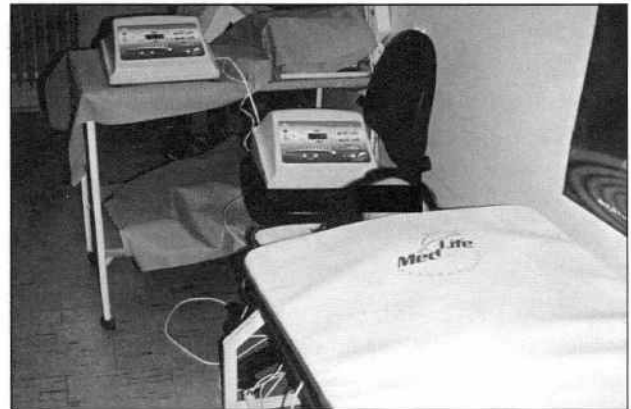
Fig. 2. The patient during the LMF procedure. Viofor JPS System Classic (two control units and double – top and bottom large applicator mats)

Magnetostimulation was administered to the patient in one time daily expositions (P2M1 program) for 60 days from the first day of her presence in the Clinic, except the periods of septic hyperthermia. The Viofor JPS Classic System double large applicator mats were used and finally the Professional one was applied at the end of cure.